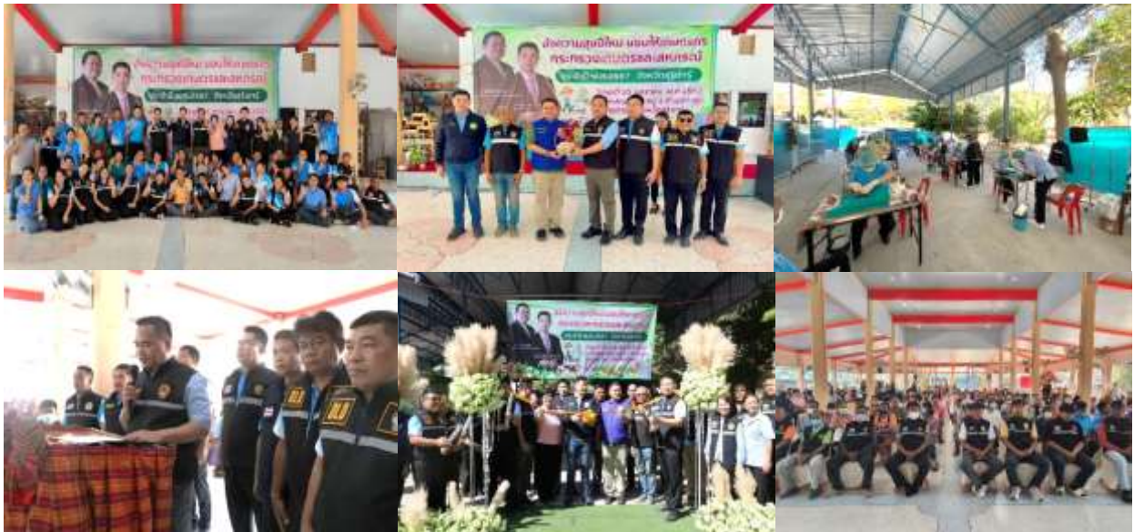
มติที่ประชุม รับทราบ